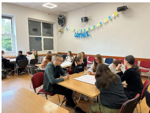
Zdjęcie 3. Spotkanie w liceum w Zielonej Górze podczas I Etapu konsultacji społecznych