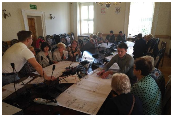
Zdjęcie 4. Spotkanie ze słuchaczami Uniwersytetu Trzeciego Wieku w Sulechowie podczas II Etapu konsultacji społecznych