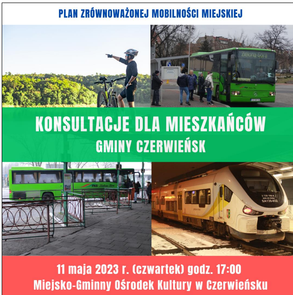
Rysunek 8. Reklama na Facebooku informująca o konsultacjach w Czerwieńsku