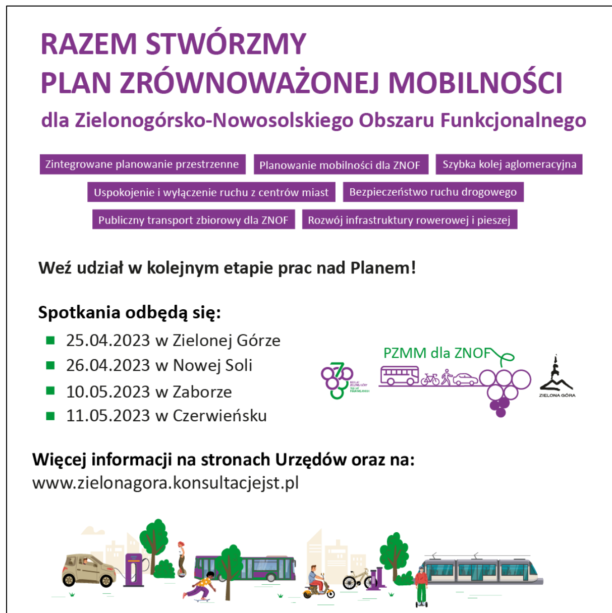
Rysunek 6. Baner informacyjny 1080x1080 px – Etap II konsultacji społecznych