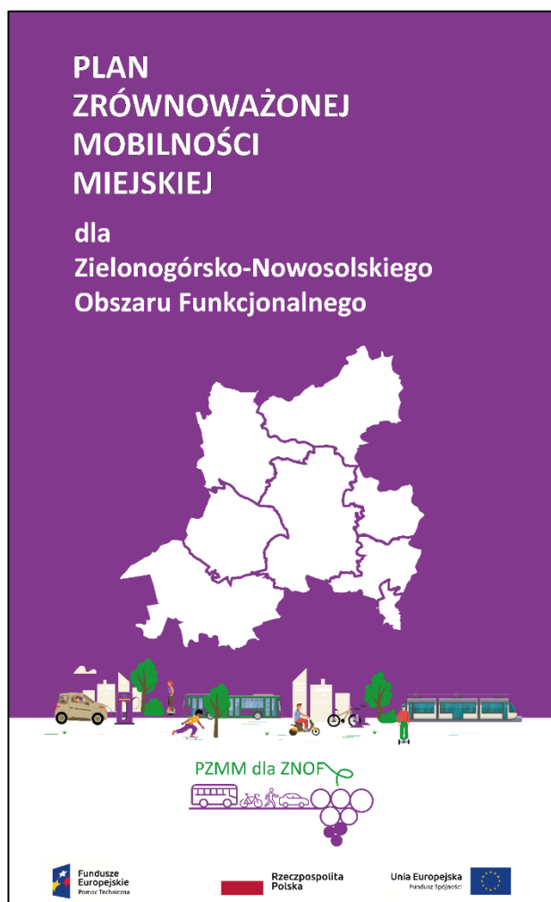
Zdjęcie 2. Roll-up PZMM dla ZNOF – grafika na nim umieszczona oraz jego wykorzystanie podczas spotkań konsultacyjnych